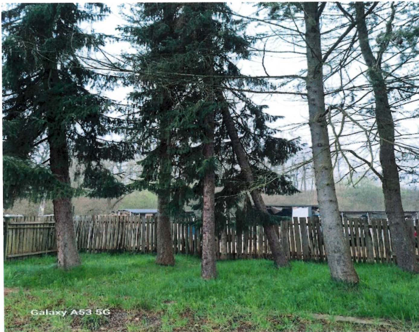
Galaxy A53 5G