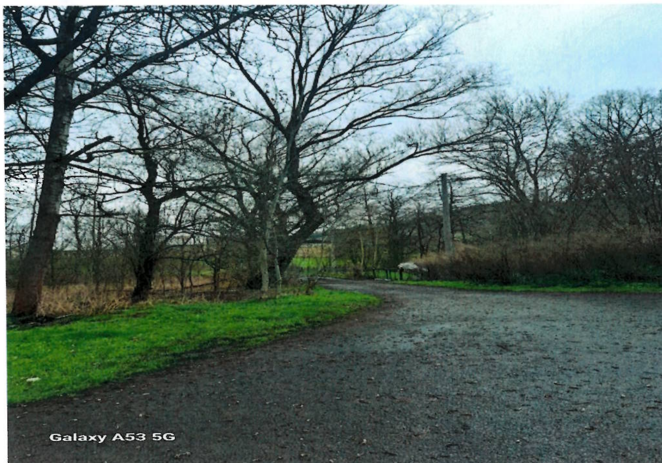
Galaxy A53 5G