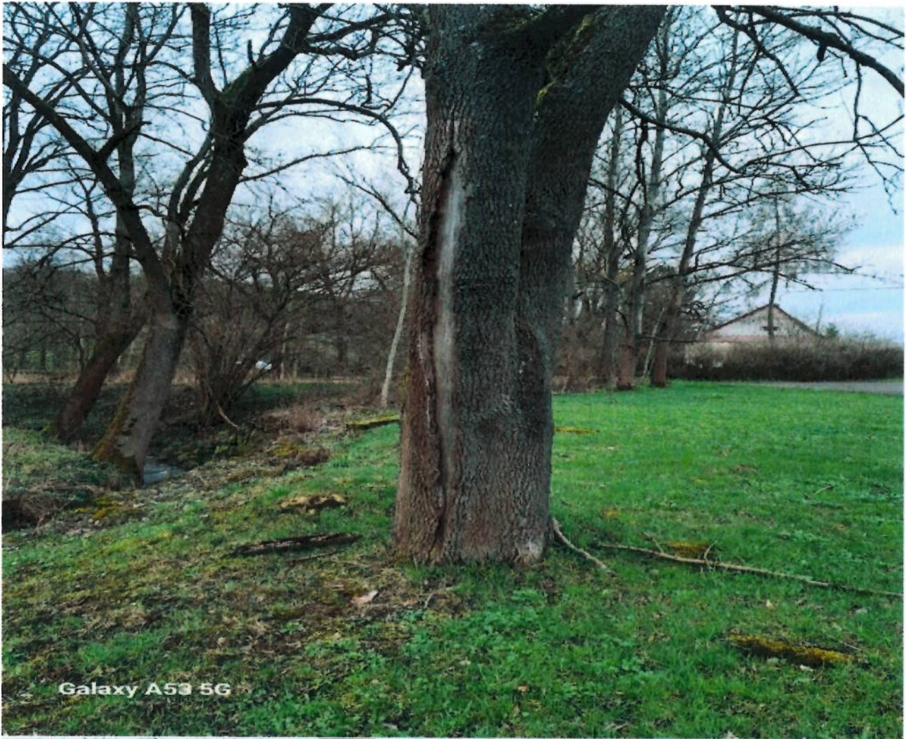
Galaxy A53 5G