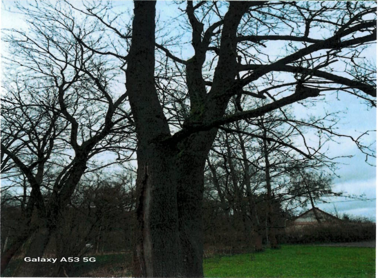
Galaxy A53 5G