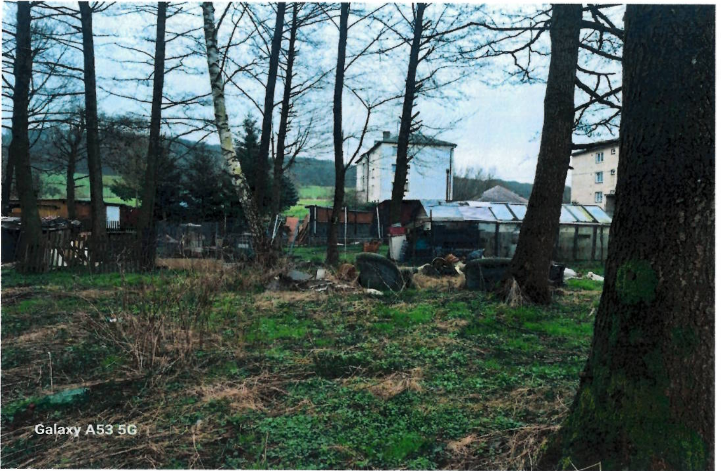
Galaxy A53 5G