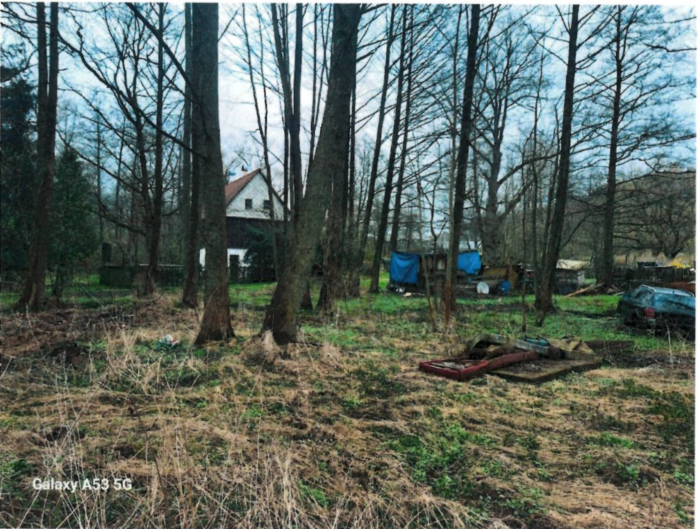
Galaxy A53 5G