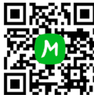
QR kód s trasou výletu.

Děkujeme všem, kteří dorazili na táborák na Zámečáku, také třem skvělým kytaristům. Bylo to moc pěkné, tak se už těšíme na příště. Jsme vděční městu, že