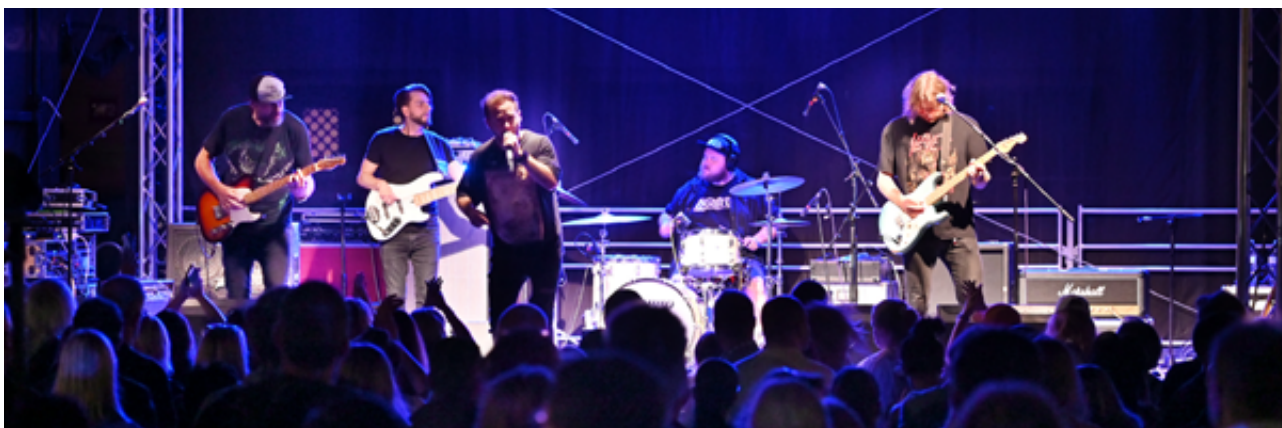
Mariánská pouť 2023