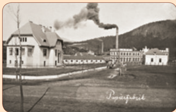
6 Pohled od Šenovské (Lužické) ulice