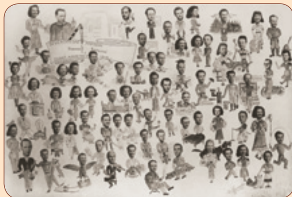
10 Tablo podnikového ředitelství z roku 1949