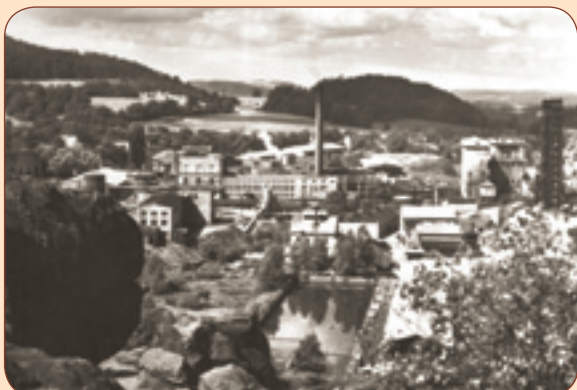
9 Papírna z pohledu od Břidličného vrchu