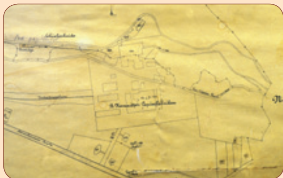
1 Mapka papíren z roku 1939