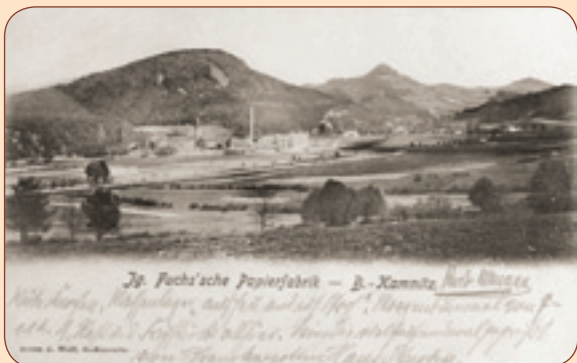
3 Pohled na papírnu kolem roku 1900