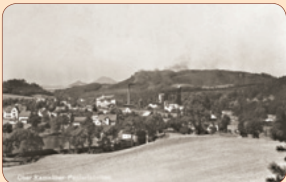
7 Papírna z pohledu přes Vesničku u Pysku