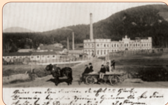
4 Pohled na papírnu kolem roku 1900