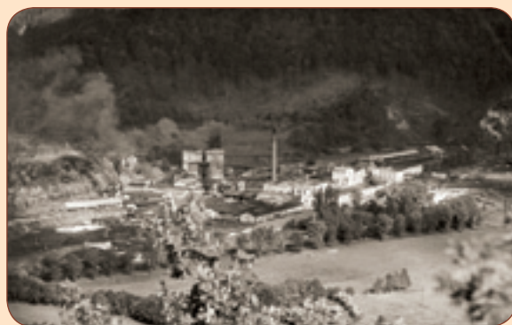
8 Papírna z pohledu ze Zámeckého vrchu