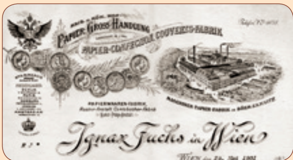
5 Firemní hlavičkový papír