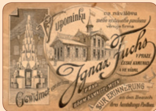
2 Brožurka vydaná v roce 1891