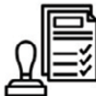
Pokuty - Přestupky