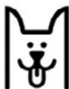
Platba poplatku za psa