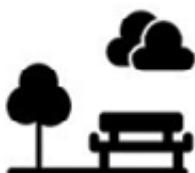
Platba poplatku za zábor veřejného prostranství