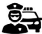
Pokuty - Městská policie