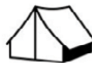
Platba za komunální odpad u rekreačních objektů